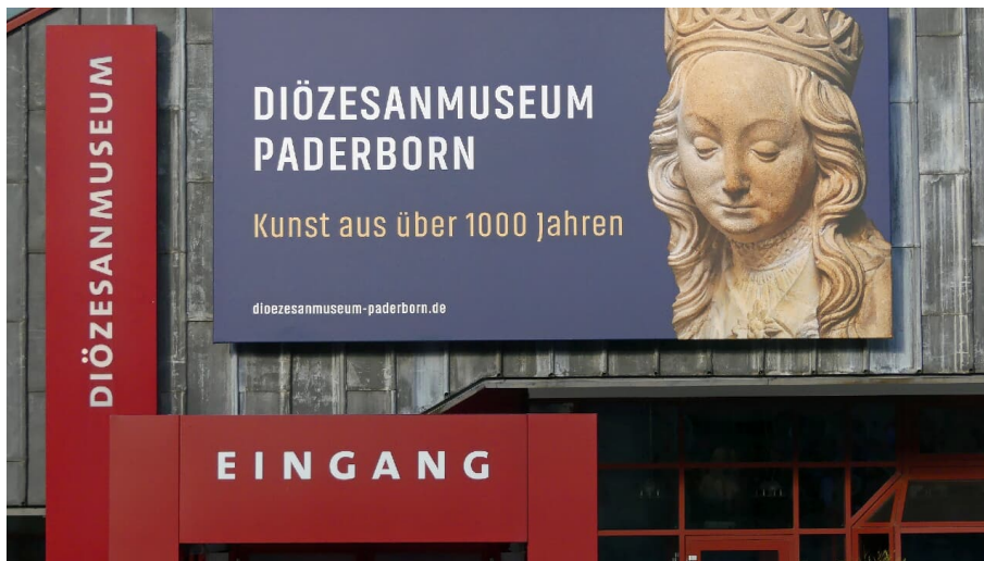
Eingang zum Diözesanmuseum