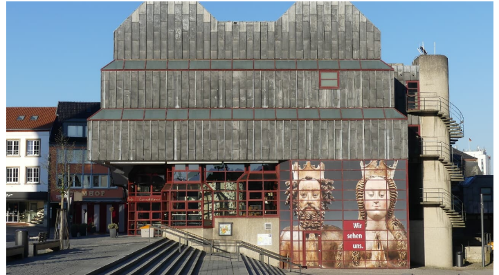
Diözesanmuseum - Ostseite - © Karl Heinz Schäfer, Tourist Information Paderborn / Verkehrsverein Paderborn e.V.