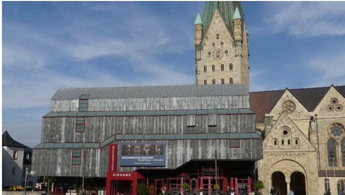
Diözesanmuseum - Südseite - © Karl Heinz Schäfer, Tourist Information Paderborn / Verkehrsverein Paderborn e.V.