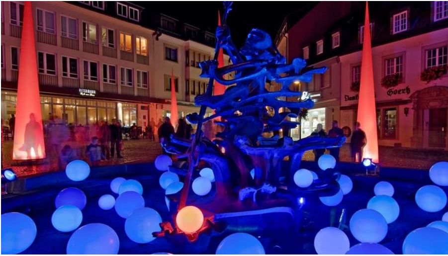
Neptunbrunnen Paderborn