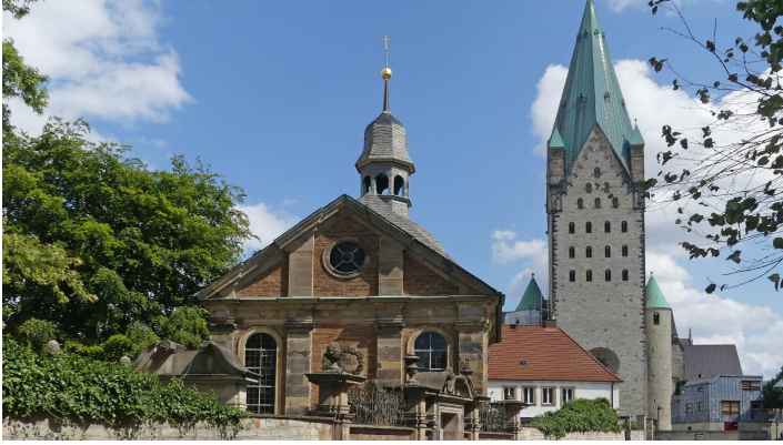
Alexiuskapelle und Dom