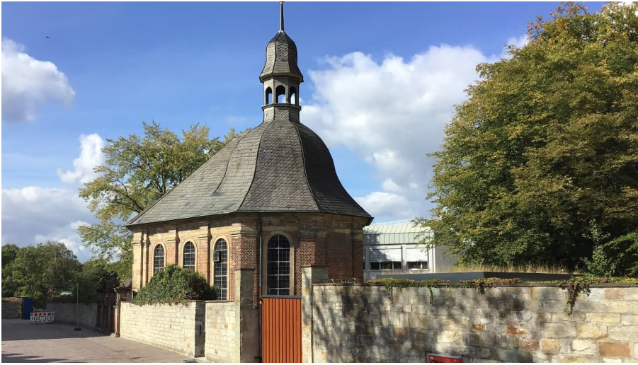
Alexiuskapelle - © Karl Heinz Schäfer, Tourist Information Paderborn