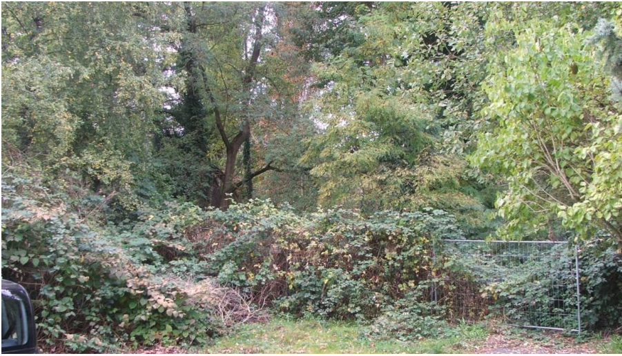
Gelände Alte Burg