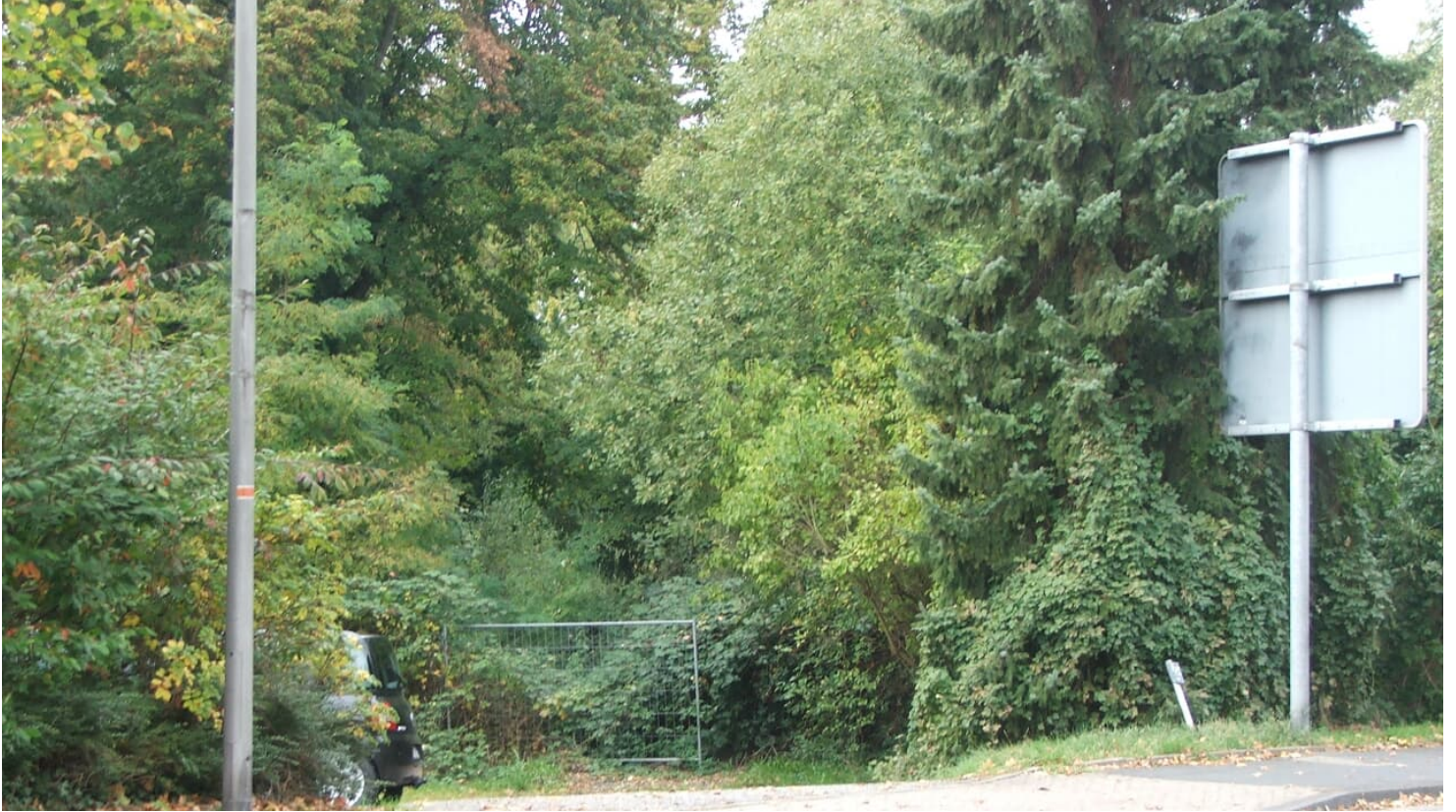
Gelände Alte Burg