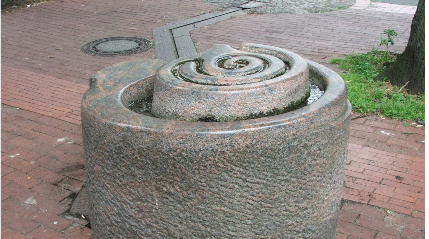
Brunnenanlage "Der Weg" - © Thevis, Thevis