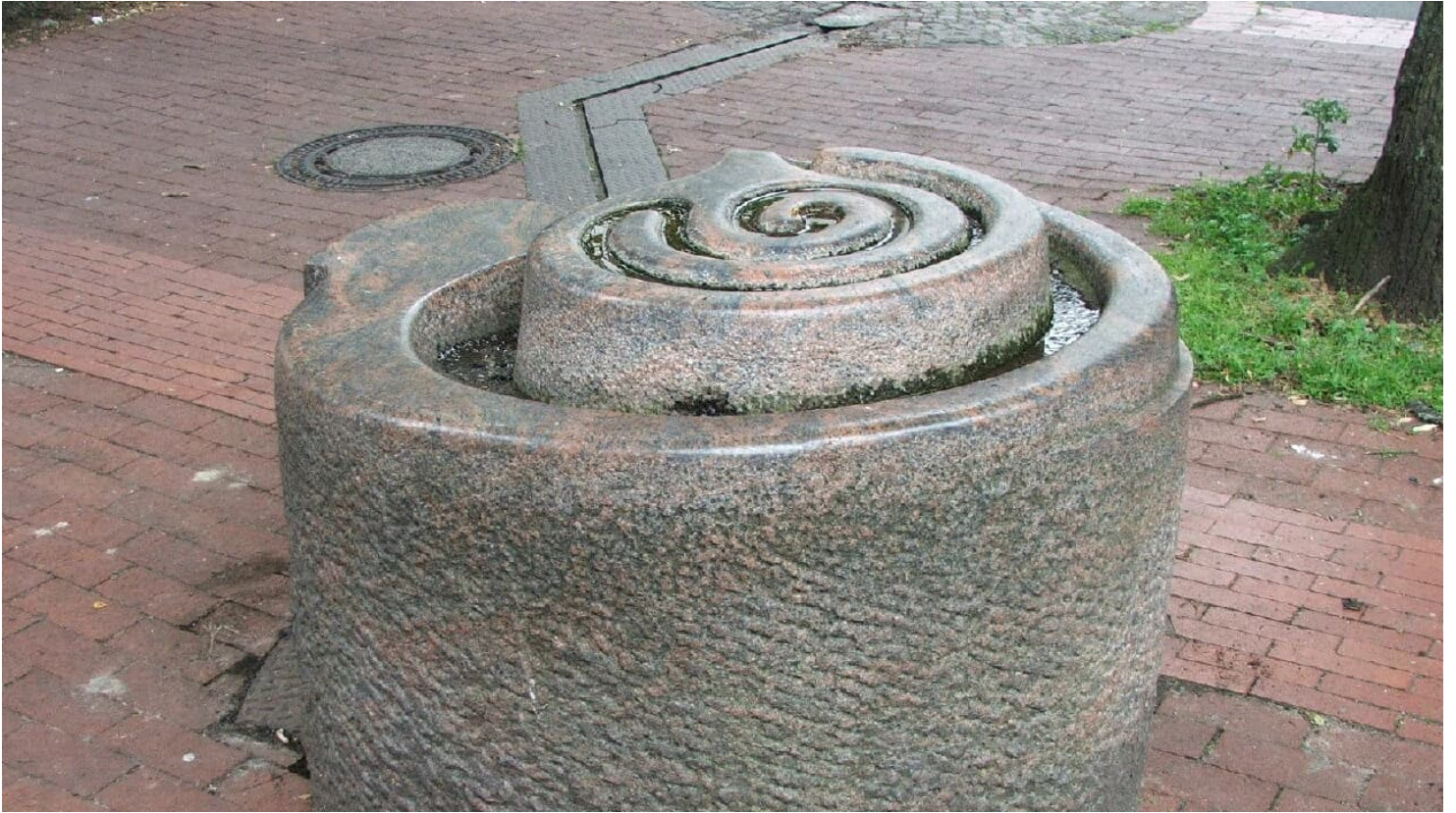
Brunnenanlage "Der Weg"