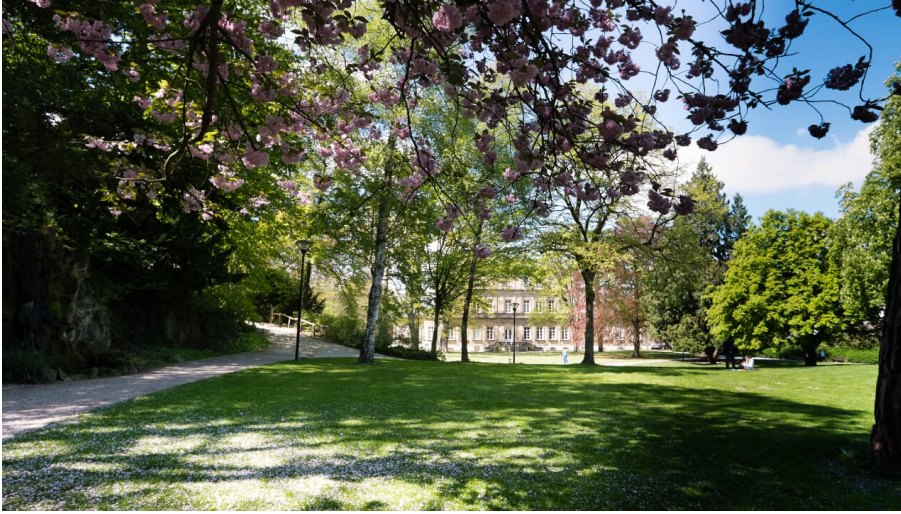
Palaisgarten Detmold