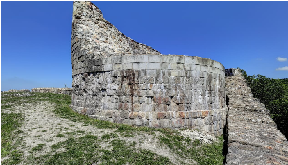
Falkenburg Detmold

Die Falkenburg ist vom 1. November 2021 bis Ende April 2022 für die Öffentlichkeit gesperrt!!