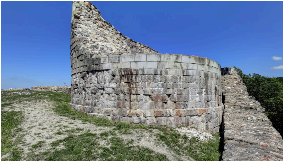
Falkenburg Detmold

Die Falkenburg ist vom 1. November 2021 bis Ende April 2022 für die Öffentlichkeit gesperrt!!