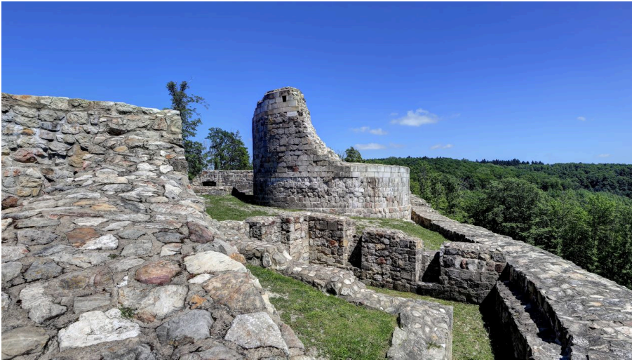
Falkenburg - © Teutoburger Wald / Detmold / F. Sieker