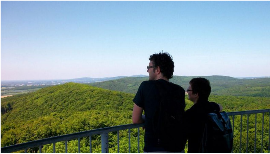
Die Aussicht genießen - © Markus Backes, Teutoburger Wald Tourismus / OstWestfalenLippe GmbH