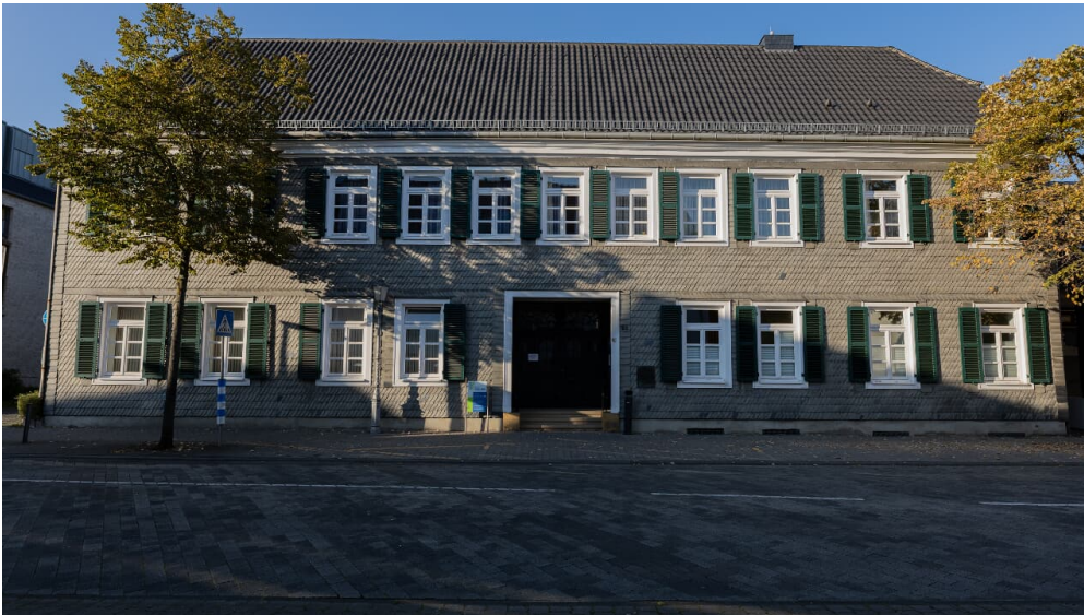
Standesamt Gütersloh