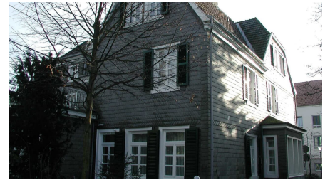
Kirchstraße Traueingang