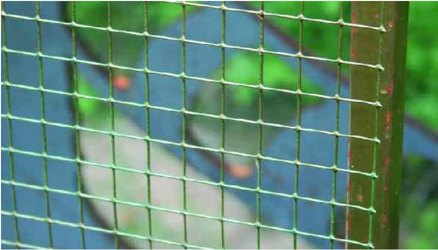
Goldener Käfig