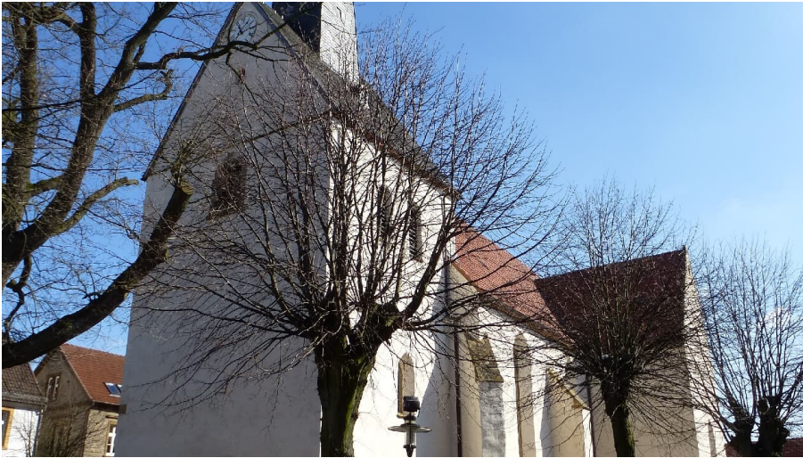
Evangelische Kirche Borgholzhausen