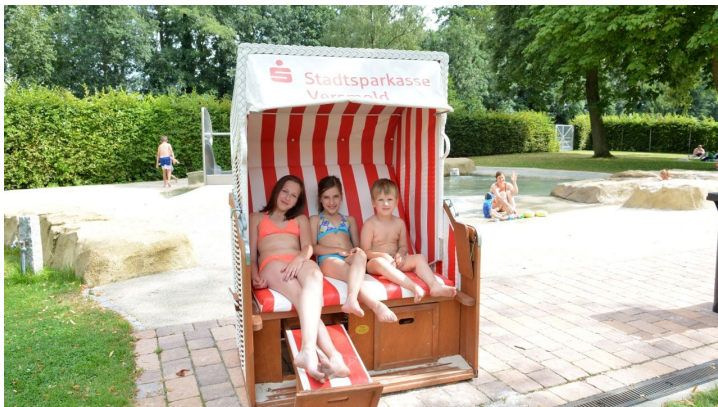
Parkbad Versmold