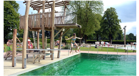
Parkbad Versmold