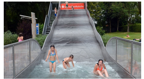
Parkbad Versmold