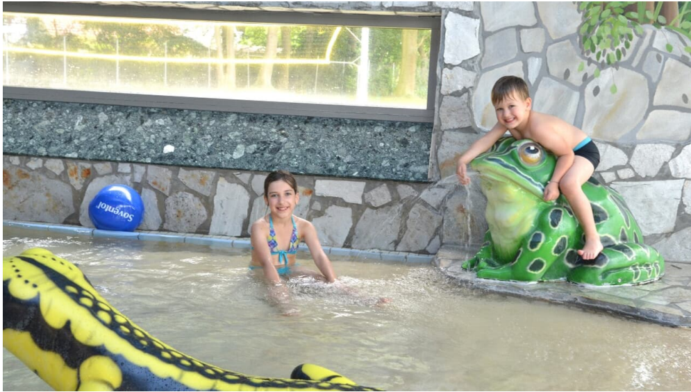
Parkbad Versmold

ein Feiertag ist, dann am 2. Freitag im Monat) ** An den Wochenenden im Winter beträgt die Wassertemperatur 30 ° C.