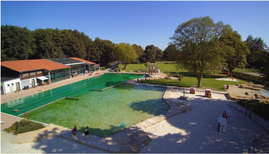
Parkbad Versmold