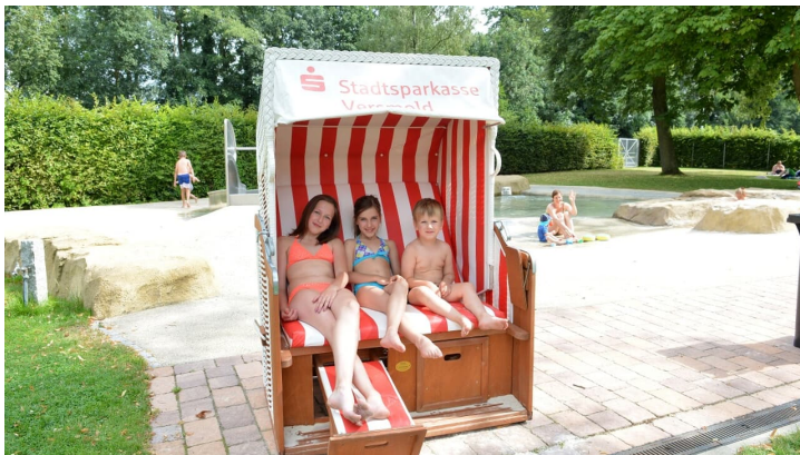
Parkbad Versmold