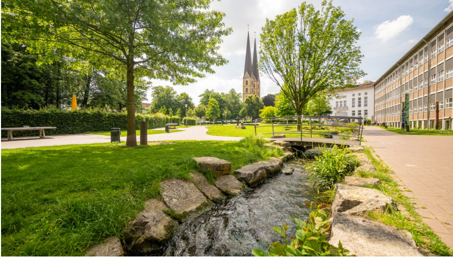
Park der Menschenrecht und Neustädter Marienkirche