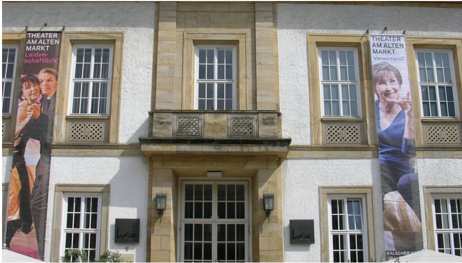
Theater am Alten Markt