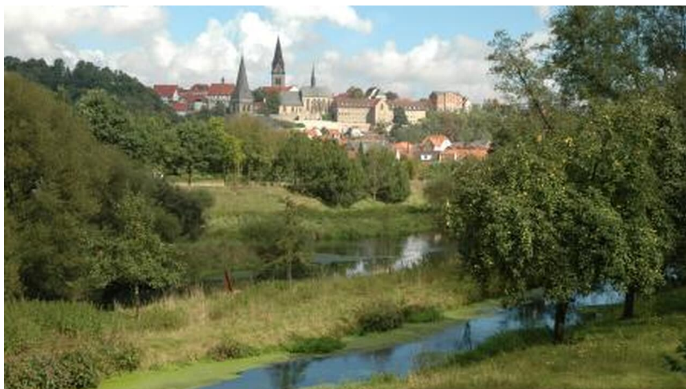
Südansicht von Warburg

Montag bis Freitag 09:00 - 13:00 Uhr und 13:30 - 18:00 Uhr Samstag 09:00-13:00 Uhr April bis Oktober (zusätzlich) Sonntag 11:00 -13:00 Uhr