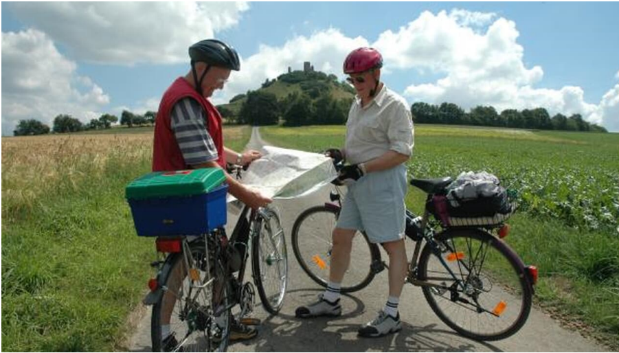
Der Desenberg: Wahrzeichen des Warburger Landes