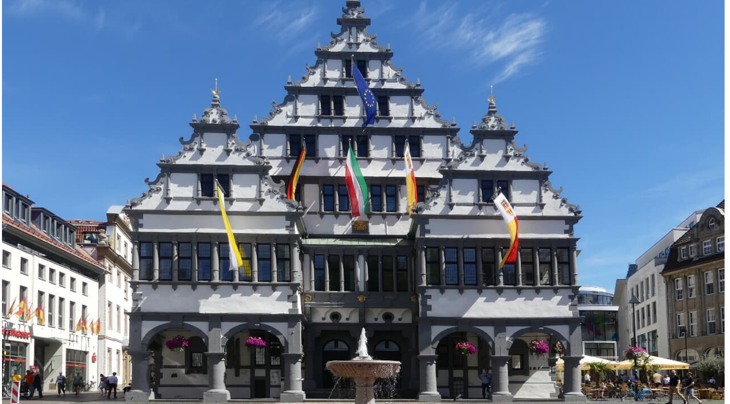
Rathaus Paderborn

Das FamilienServiceCenter ist zu folgenden Zeiten geöffnet: Montag bis Donnerstag 10.00 - 12.30 Uhr und 14.00 - 17.00 Uhr Freitag und Samstag 10.00 - 13.00 Uhr Der Rathaussaal kann leider nicht besichtigt werden.