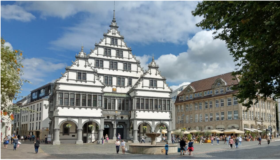
Rathausplatz Paderborn