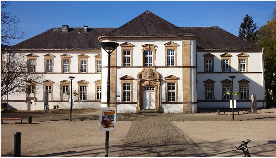
Stadtbibliothek - Ostansicht