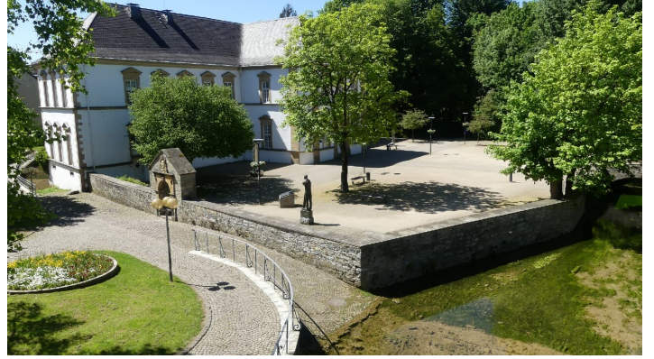
Stadtbibliothek und Quellbecken der Dielenpader