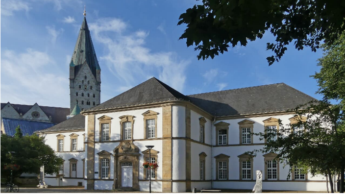
Stadtbibliothek Paderborn