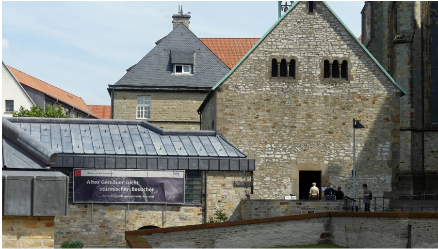
Bartholomäuskapelle, Außenansicht