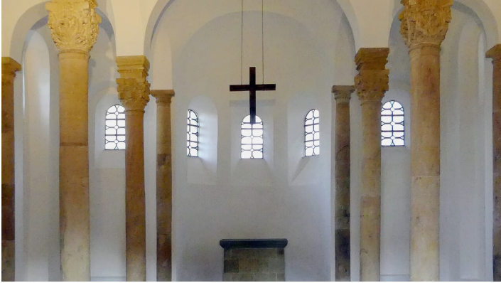
Bartholomäuskapelle, Innenansicht