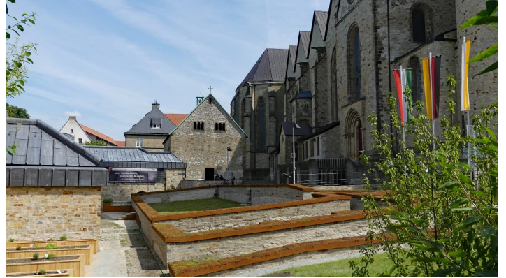
Kaiserpfalz mit Bartholomäuskapelle