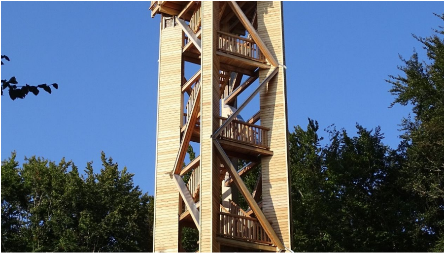
Wiehenturm - © Touristik Preußisch Oldendorf, Stadt Preußisch Oldendorf