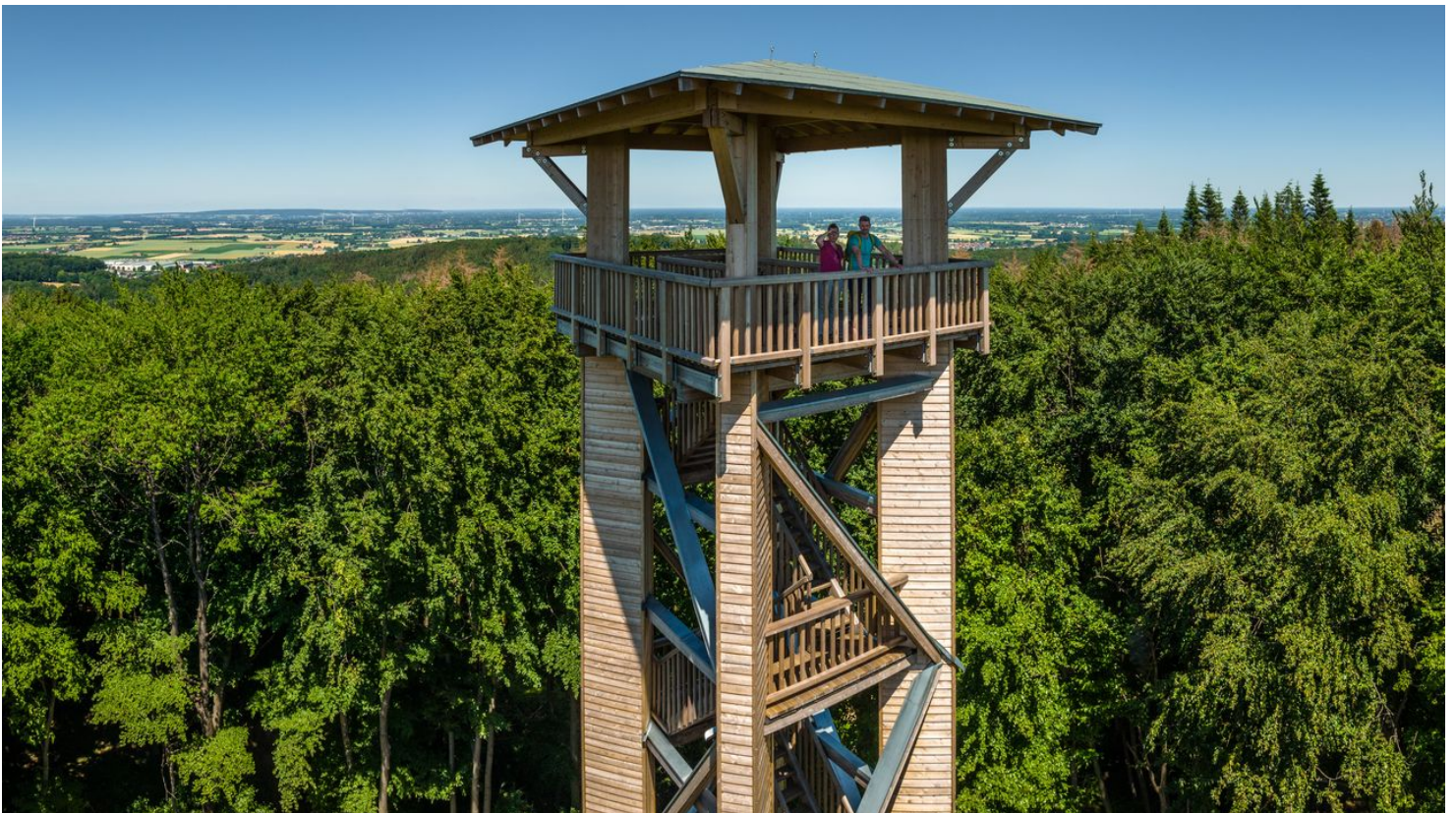
Preußisch Oldendorf-Wiehenturm-Teutoburger-Wald-Tourismus-D-Ketz-077.jpg