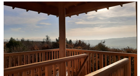
Wiehenturm im Herbst (13).jpg