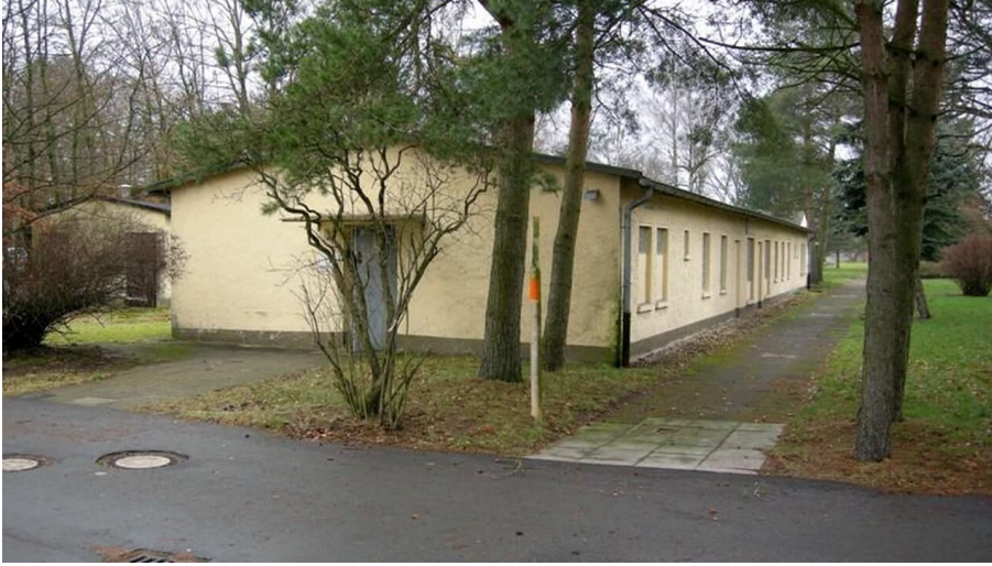
Gebäude der Dokumentationsstätte Stalag 326