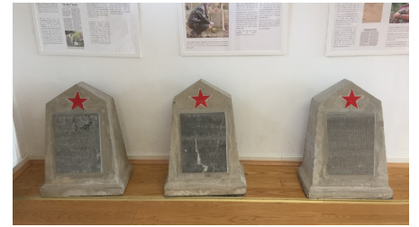
Grabsteine in der Gedenkstätte Stalag 326 VIK