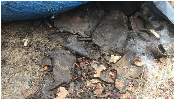
Schuhsohlen in der Gedenkstätte Stalag 326 VIK