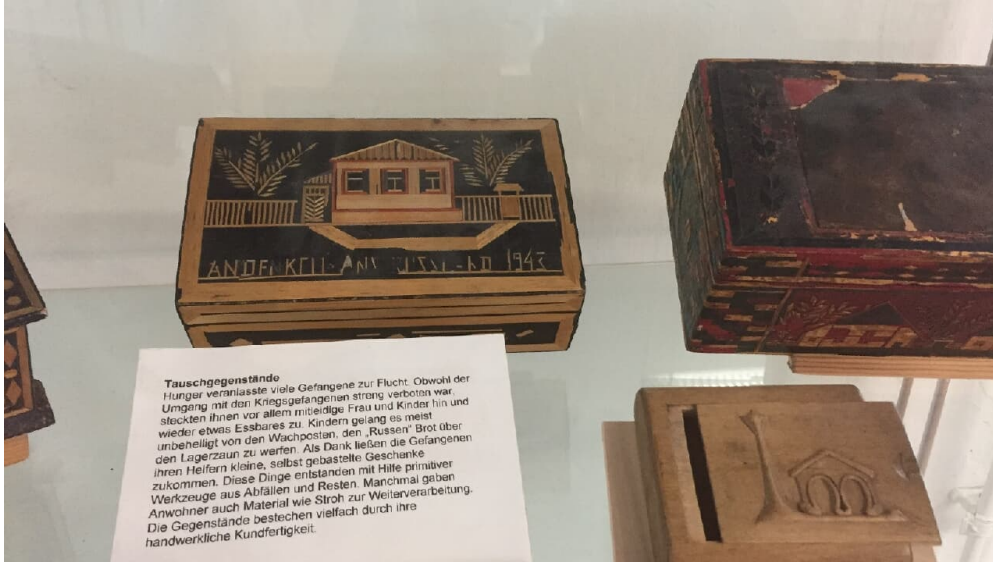
Ausstellungsstücke in der Gedenkstätte Stalag 326 VIK