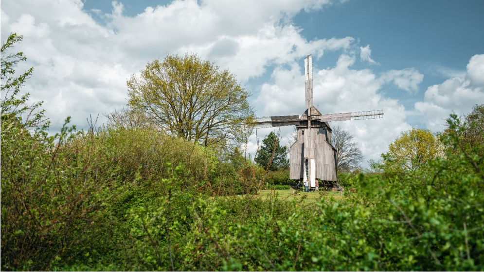
Fotowalk Tourismusverband Sieben (16 von 132).jpg