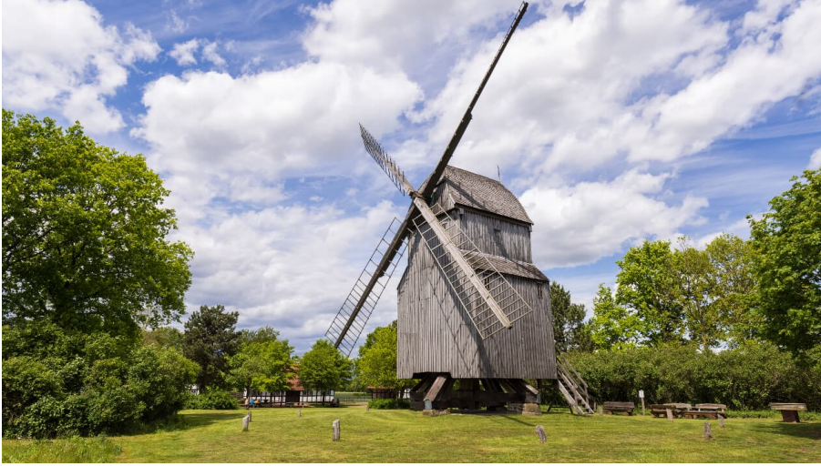
Bockwindmühle Oppenwehe