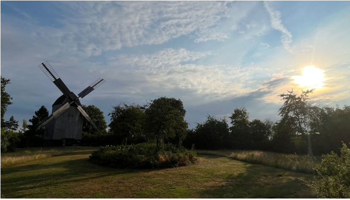
Mühle Whedem Jörg Bartel (2).jpg