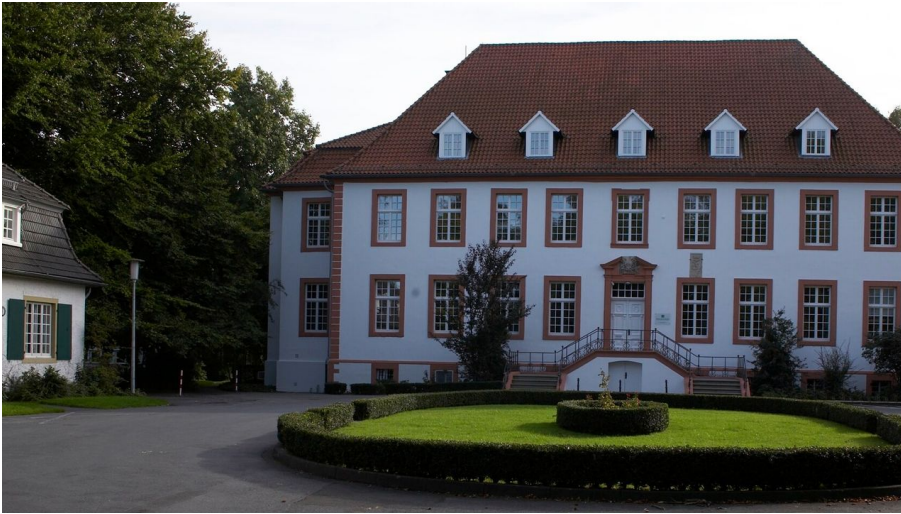
Reckenberg in Wiedenbrück