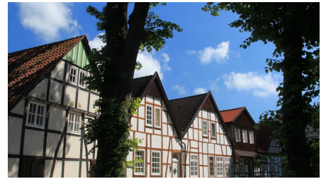
Dorfkern Bockhorst