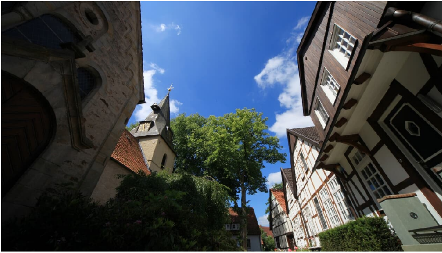
Dorfkern Bockhorst