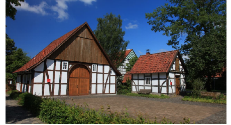
Bockhorster Kotten & Backhaus