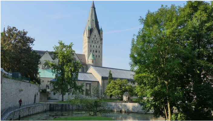
Dom und Kaiserpfalz

Ein Innenbesuch des Domes ist täglich von 10 bis 17 Uhr möglich, außer zu Gottesdienstzeiten.