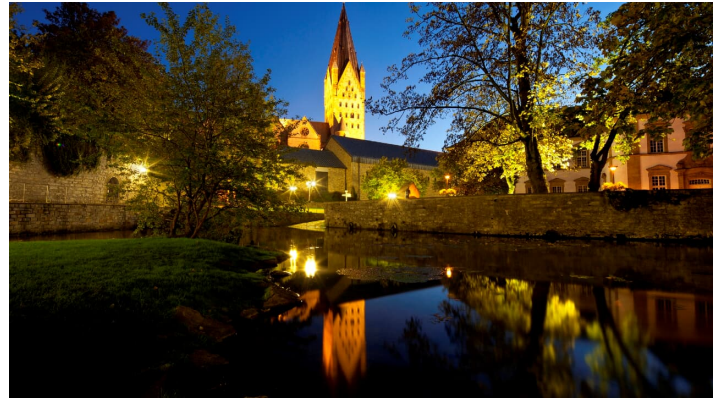
Blick auf Dom, Kaiserpfalz und Dielenpader