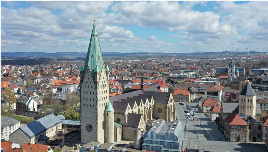
Dom aus der Luft