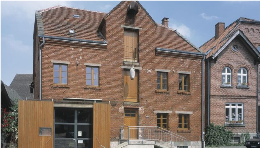
Deutsches Sackmuseum