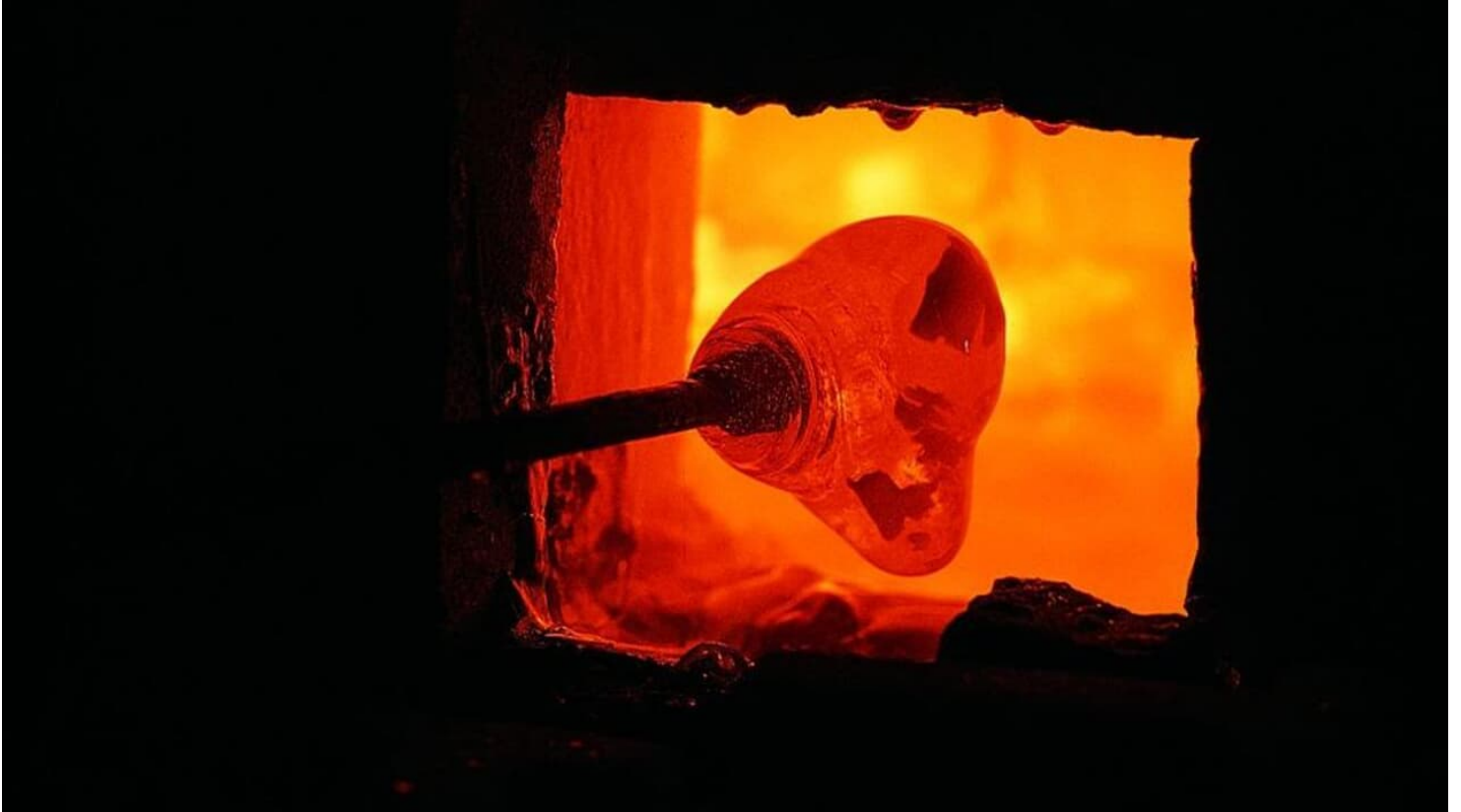
Glashandwerk und -handel

ID: p_100038554 Zuletzt geändert am 11.04.2024, 10:15