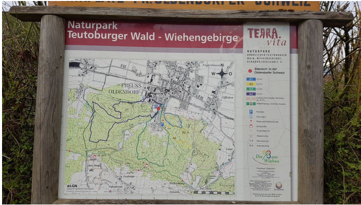
Informationstafel am Wanderparkplatz Oldendorfer Schweiz