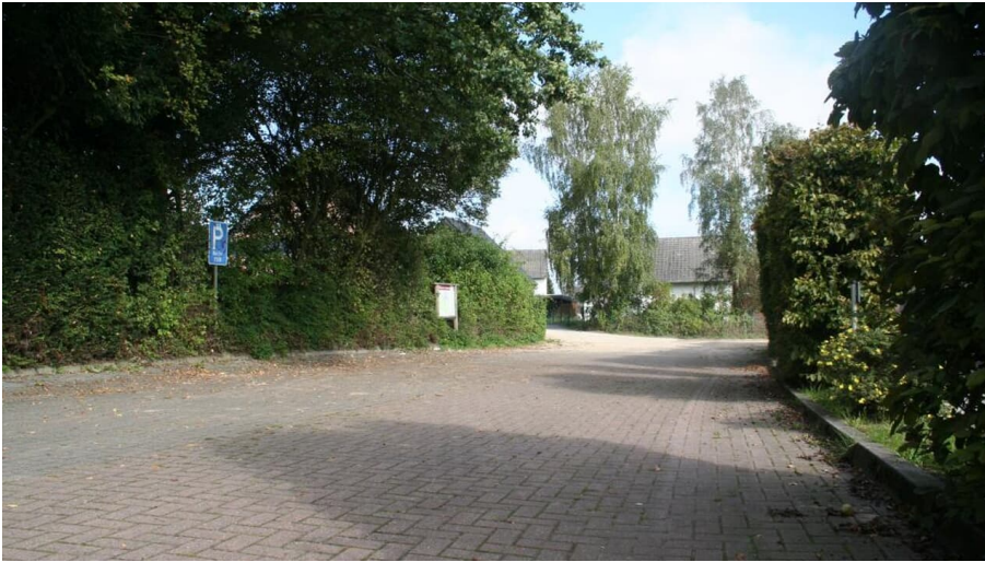
Wanderparkplatz "Oldendorfer Schweiz"