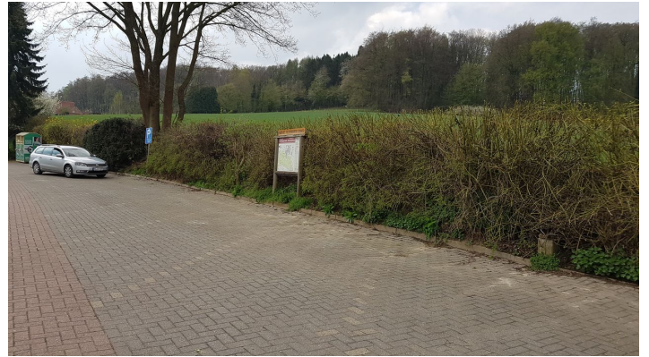
Wanderparkplatz Oldendorfer Schweiz