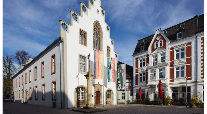
Rolandsäule auf dem Marktplatz