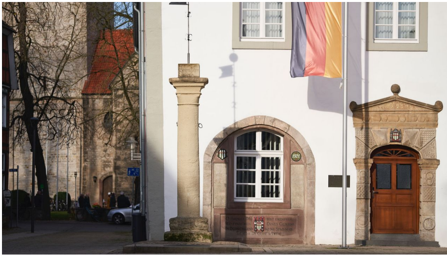
Rolandsäule auf dem Marktplatz