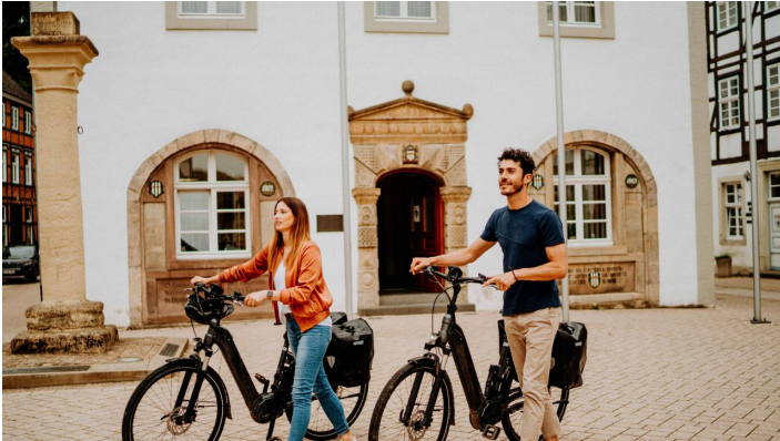
Marktplatz Brakel