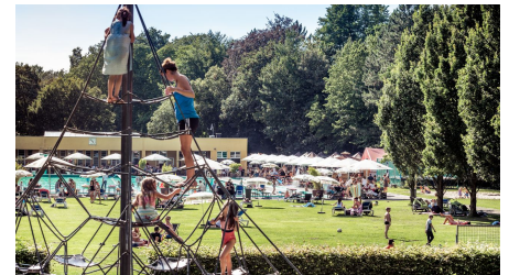
Klettergerüst Parkbad Gütersloh