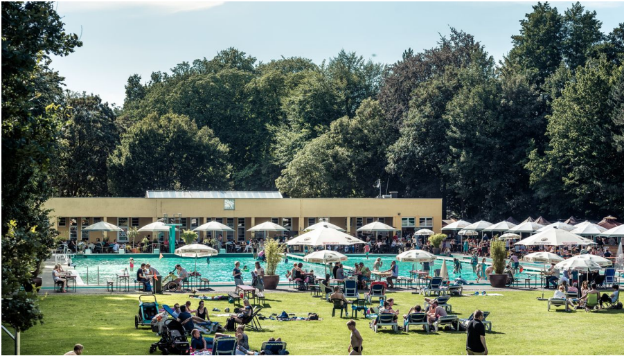
Parkbad Gütersloh