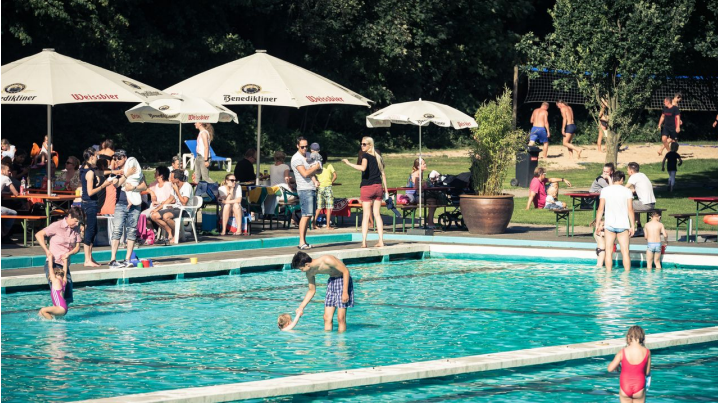
Planschbecken Parkbad Gütersloh