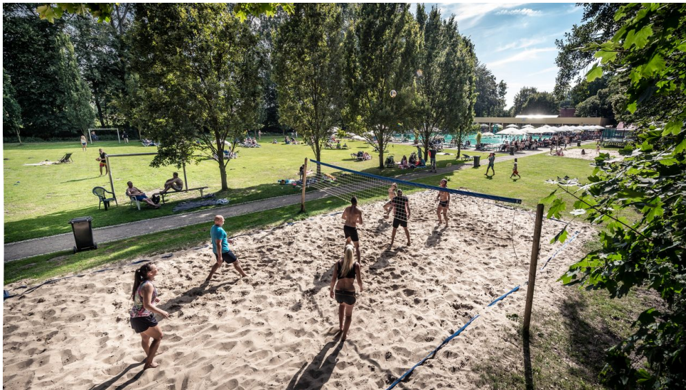
Volleyball Parkbad Gütersloh