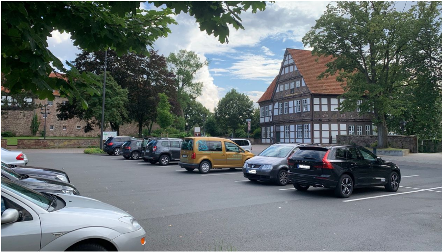
Blomberg Marketing e.V., Blomberg Marketing e. V.