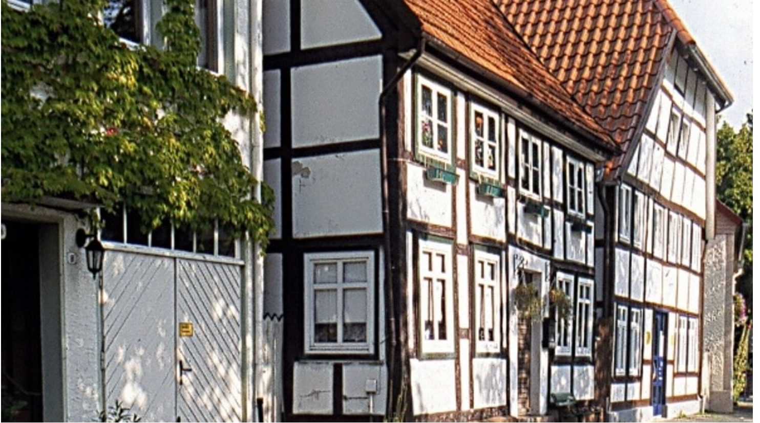
Am Pideritzplatz