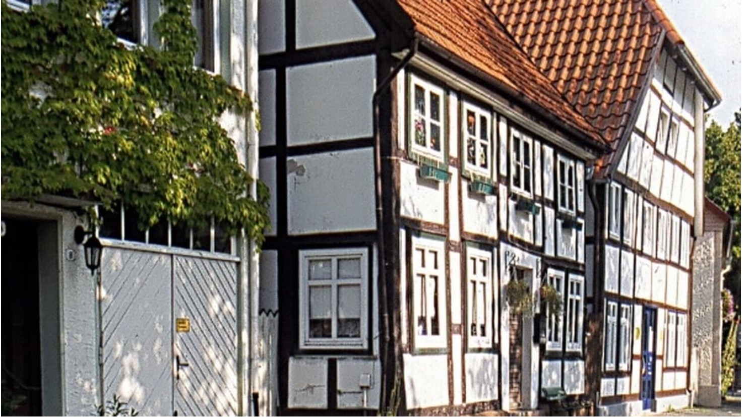
Am Pideritzplatz