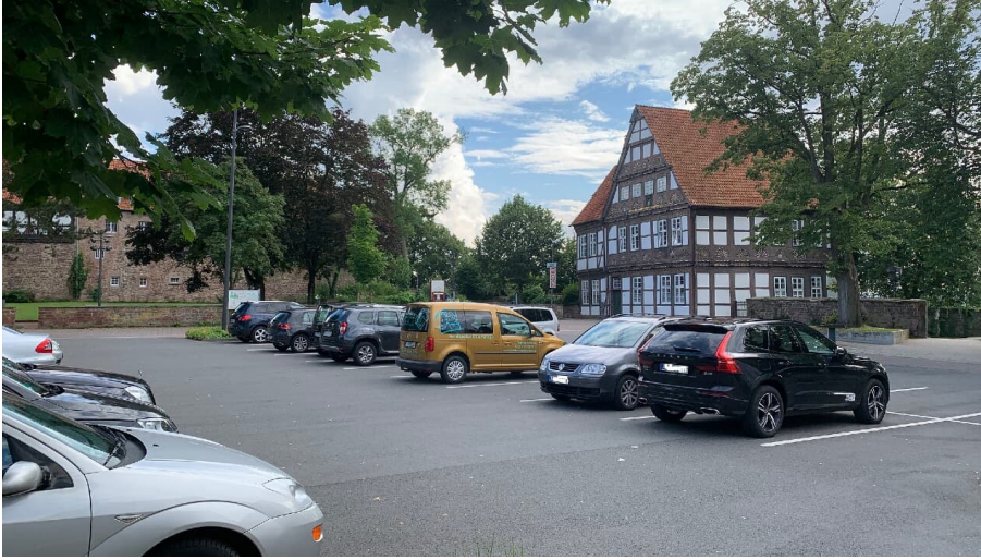
Blomberg Marketing e.V., Blomberg Marketing e. V.