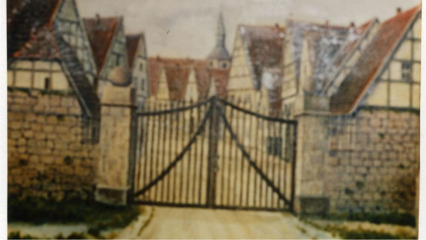
Blomberg Marketing e. V.