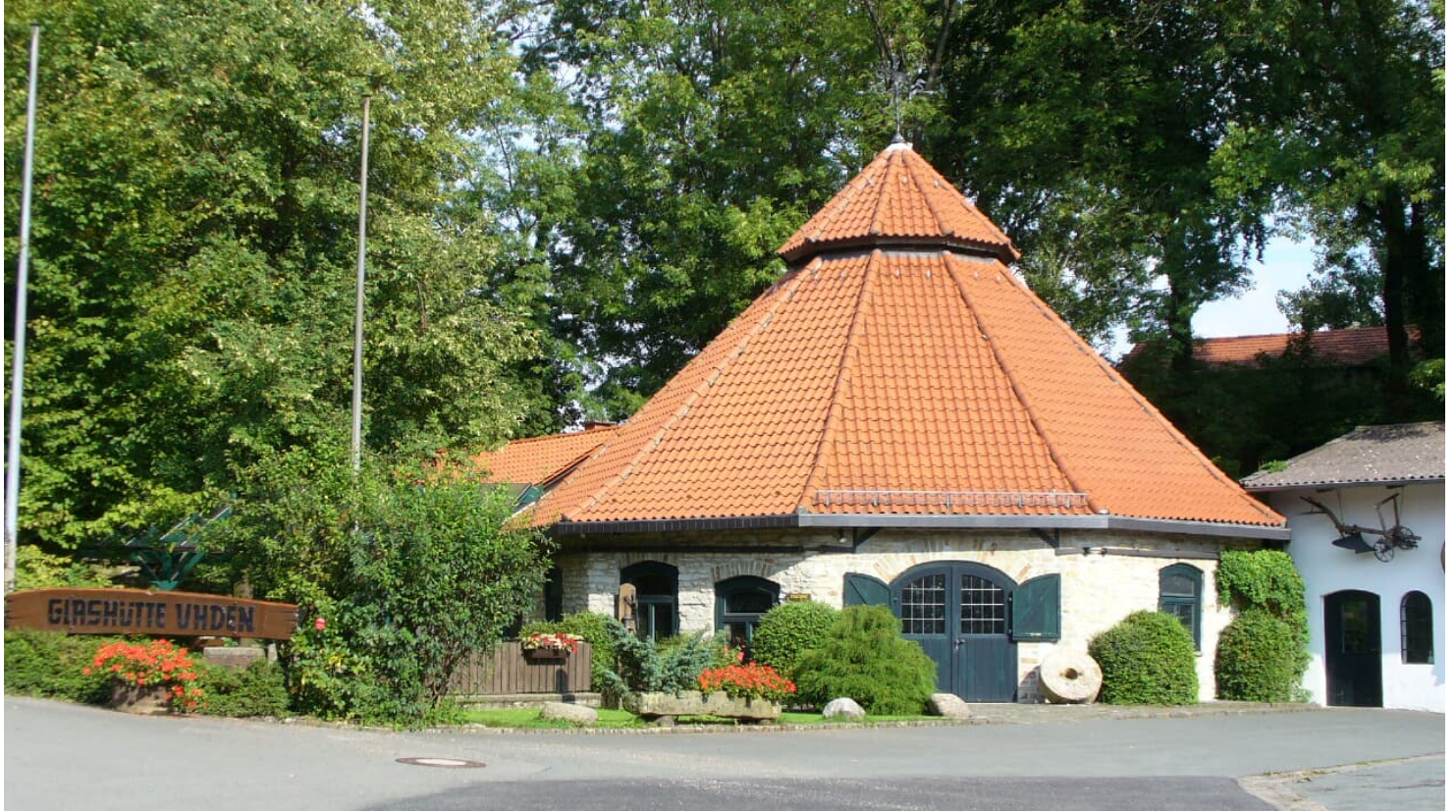
Glashütte Uhden bei Paderborn-Neuenbeken