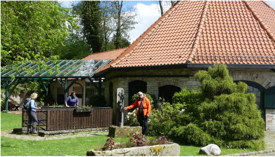
Glashütte Uhden bei Paderborn-Neuenbeken