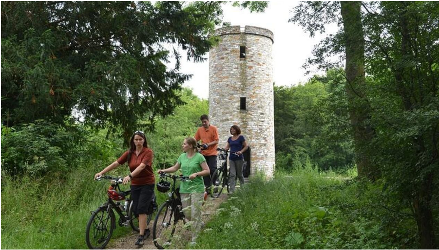
Lichtenturm (Haxter Warte) mit Radfahrern