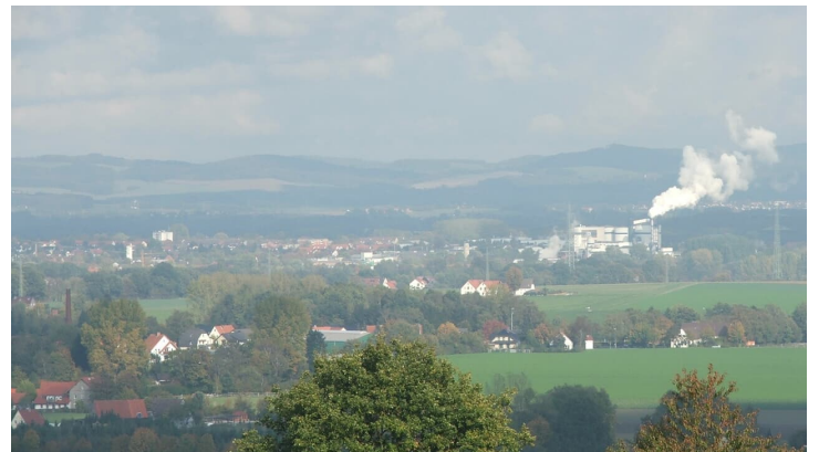
Blick nach Lage