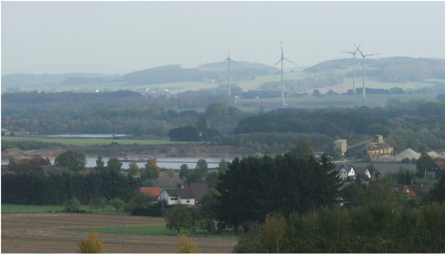
Blick zu den Kiesteichen