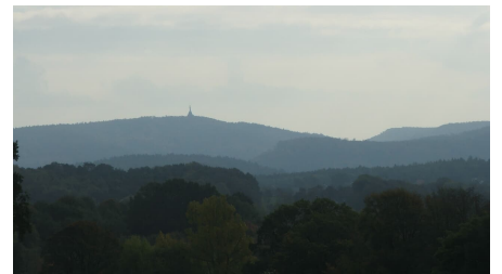
Blick zum Hermannsdenkmal