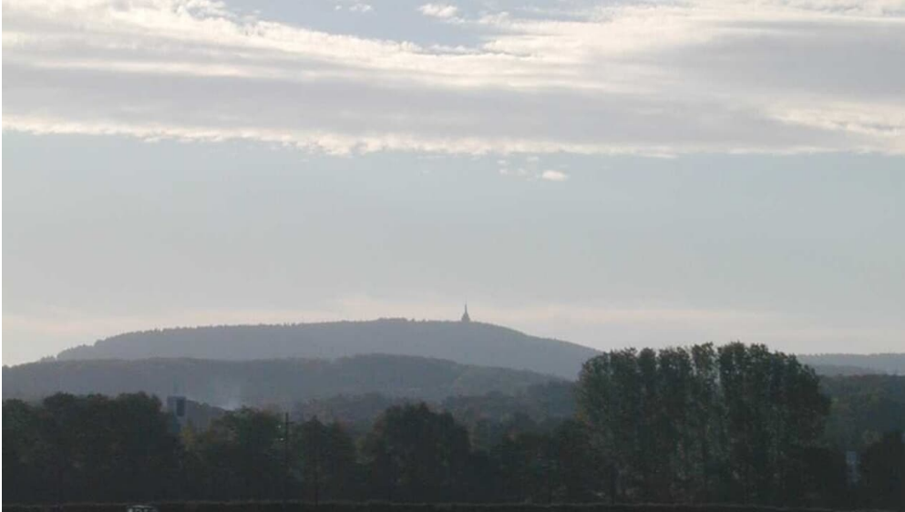
Blick zum Hermannsdenkmal