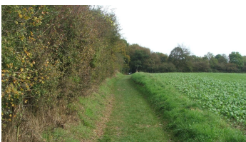
Blick auf die Egge