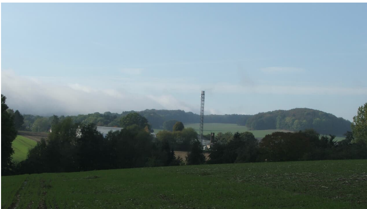
Blick von der Egge