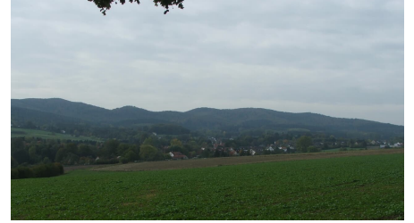
Blick auf Hörste