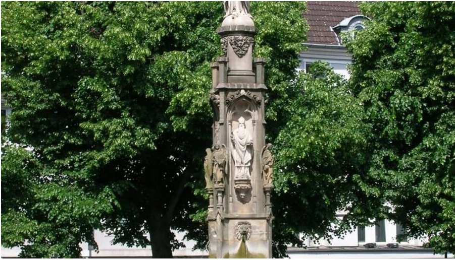
Mariensäule auf dem Marienplatz