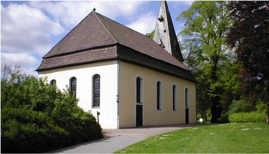
Kirche Stapelage