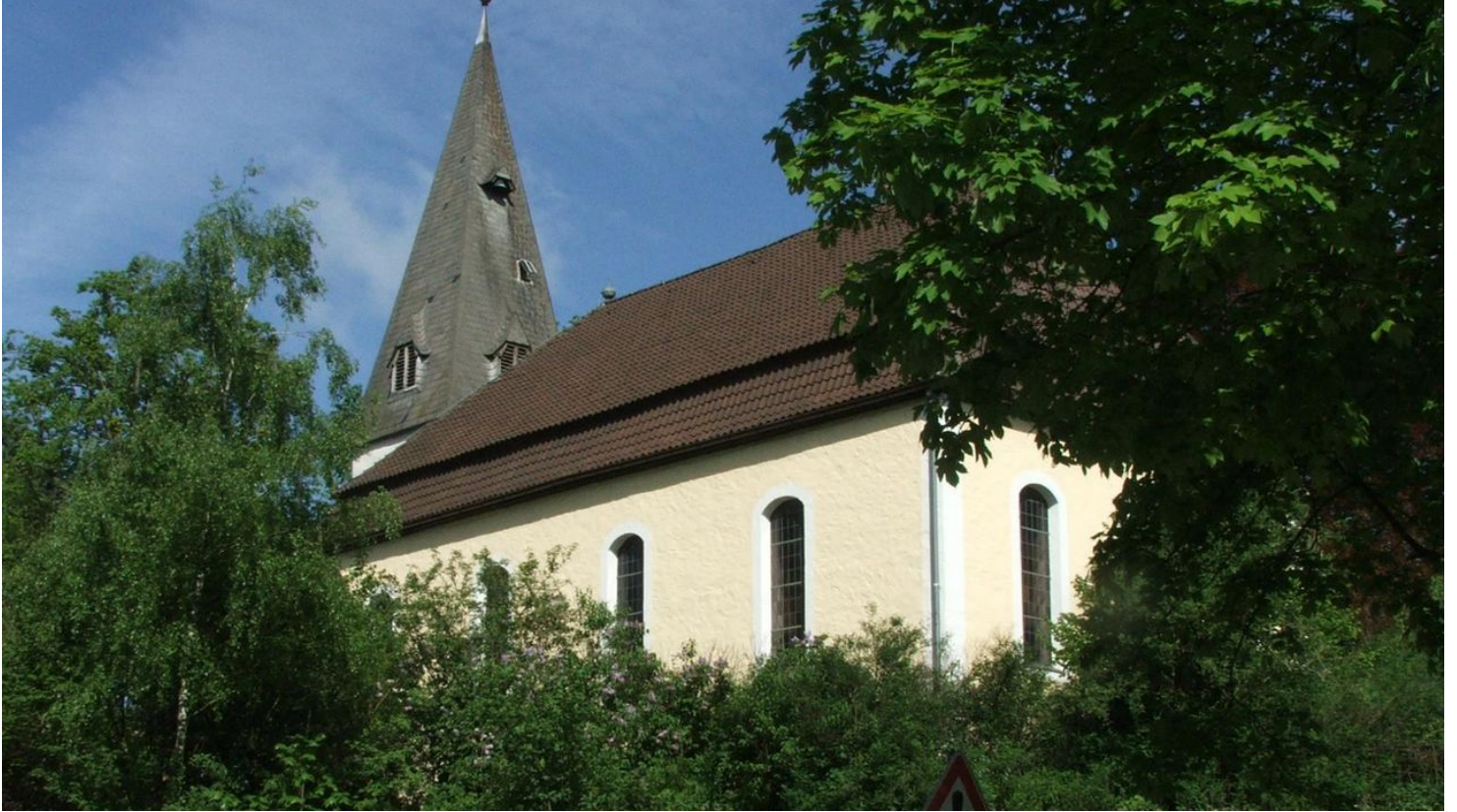
Kirche Stapelage - © Thevis, Thevis

Quelle: destination.one ID: p_100038629 Zuletzt geändert am 26.04.2024, 20:01