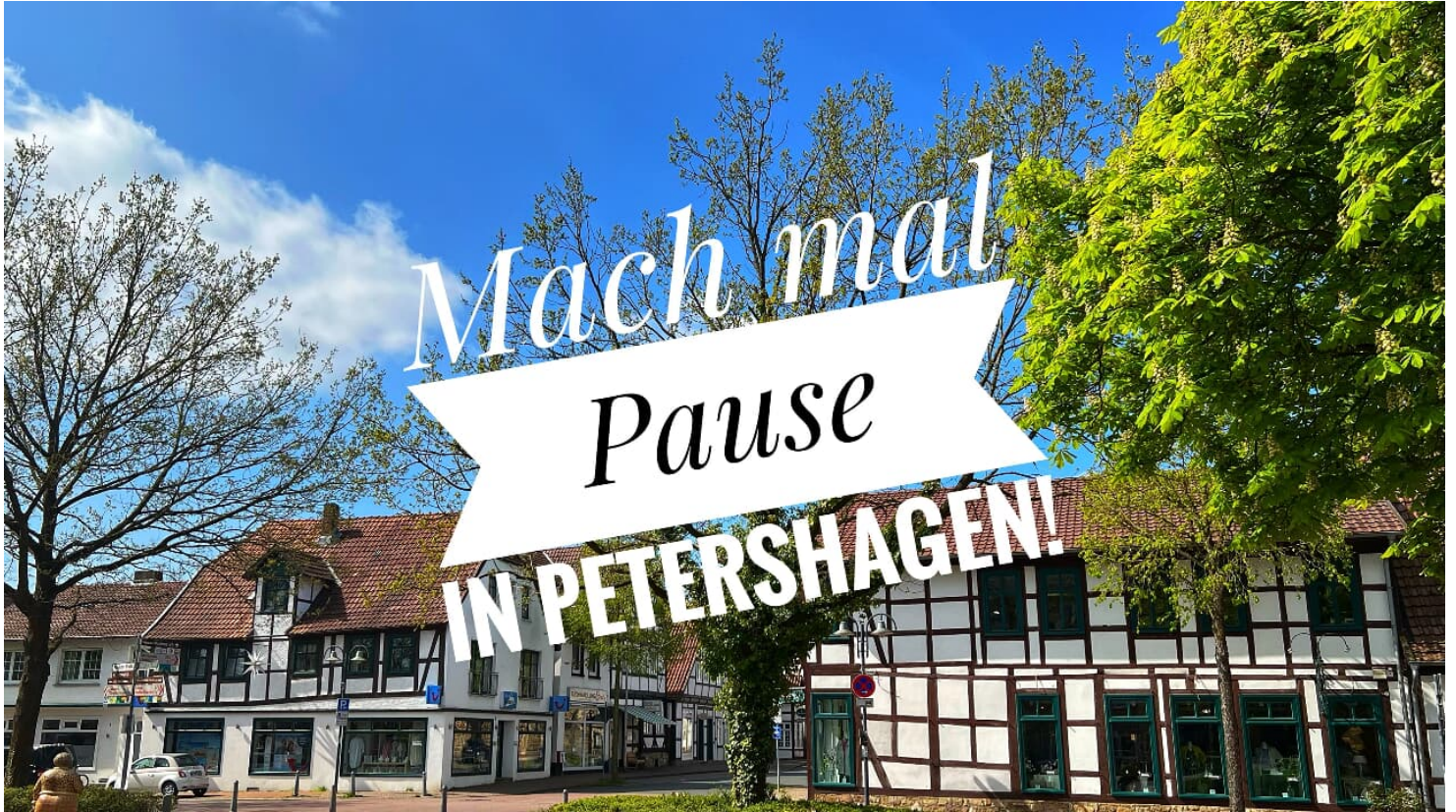
Symbolfoto.jpg