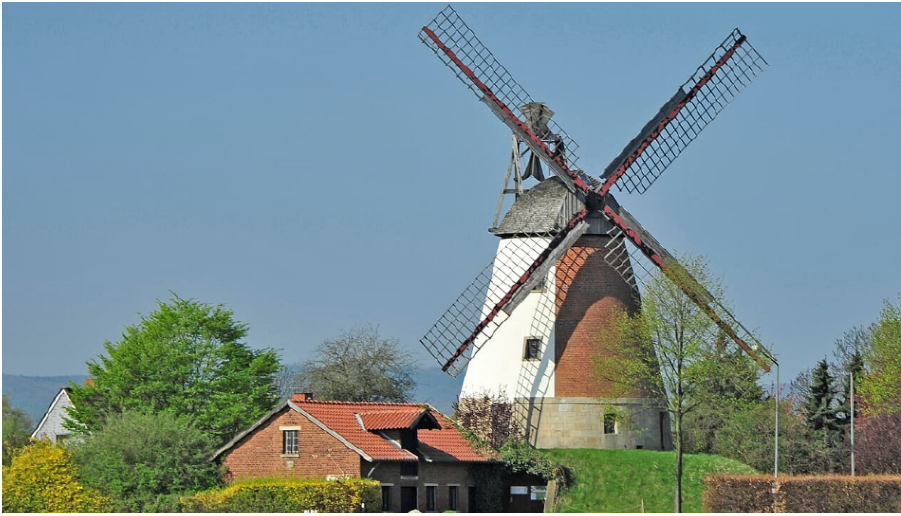
Windmühle Meißen