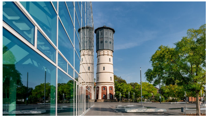
Wasserturm Gütersloh