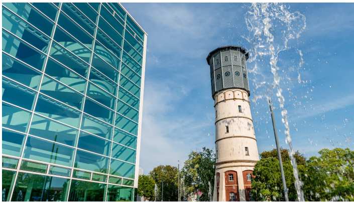
Wasserturm-Theater - © Teutoburger Wald, Gütersloh, M. Wallenfang