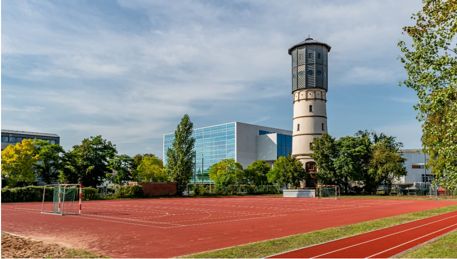
Wasserturm-Theater-GT-M.Wallenfang (1).jpg