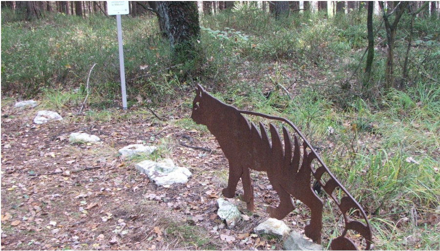
Schonraum für Wildkatzen