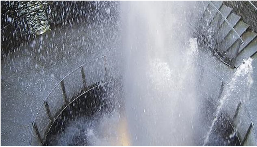
Blick in den Wasserkrater auf dem Gelände der Aqua Magica