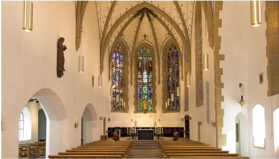
Innenansicht St. Jodokus Kirche - © Teutoburger Wald/Pfarrbüro Jodokuskirche/Ansgar Hoffmann