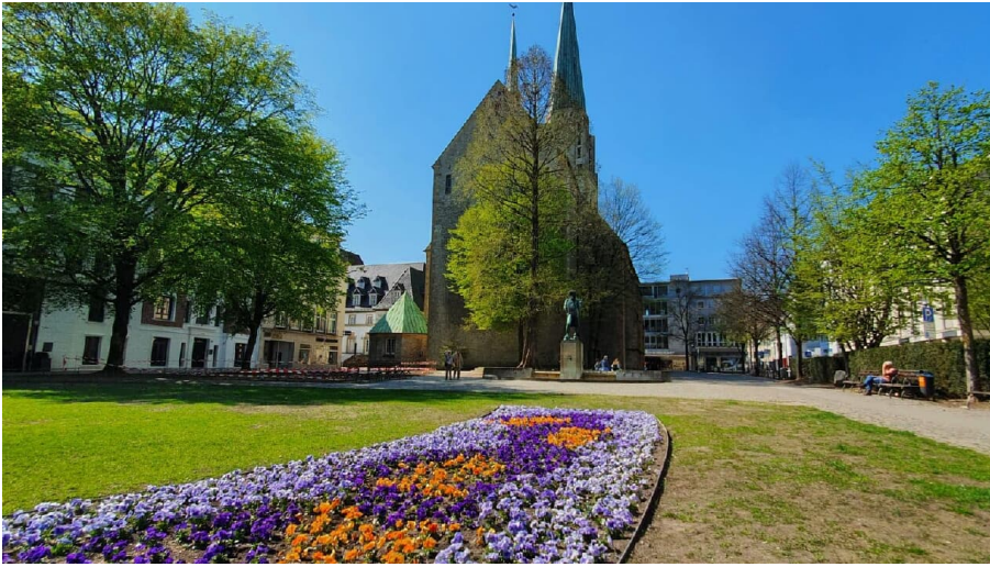
Blick auf die Altstädter Nikolaikirche