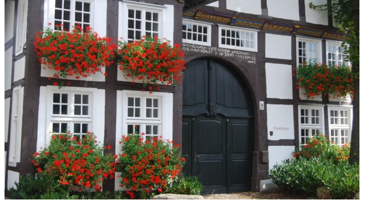
Heimathaus Rietberg