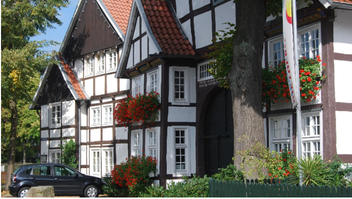
Heimathaus Rietberg