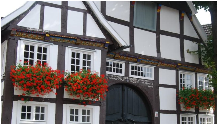
Heimathaus Rietberg