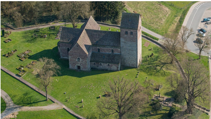
Luftbild St. Kilianskirche