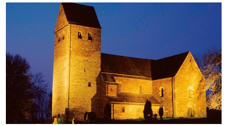
St. Kilianskirche bei Nacht