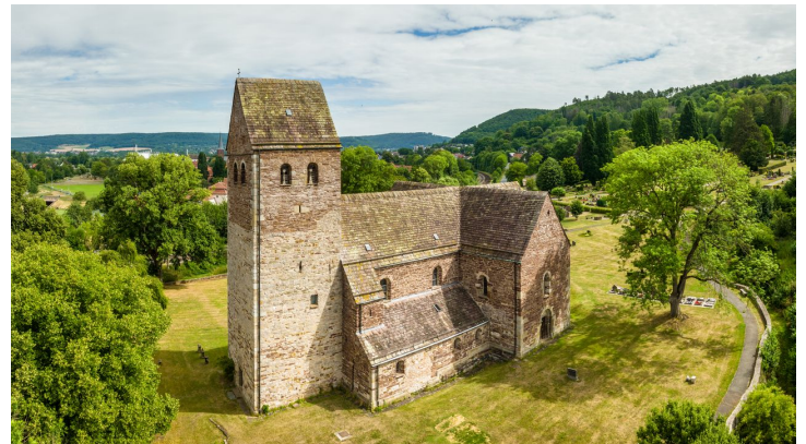
Lügde-Sankt Kilianskirche-Teutoburger-Wald-Tourismus-D-Ketz-030.jpg