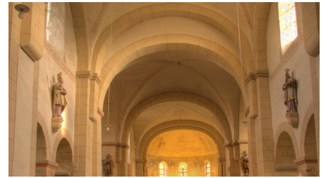
Der Altarraum der St. Kilianskirche