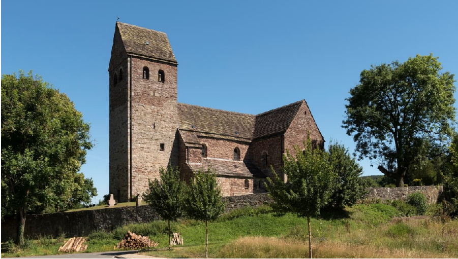
St. Kilianskirche Lügde