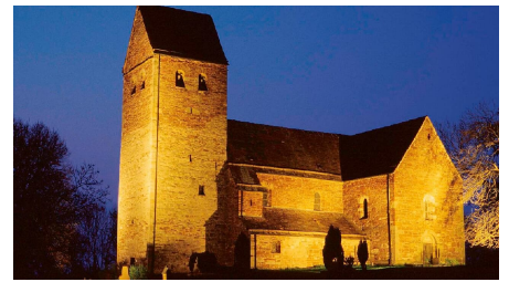
St. Kilianskirche bei Nacht