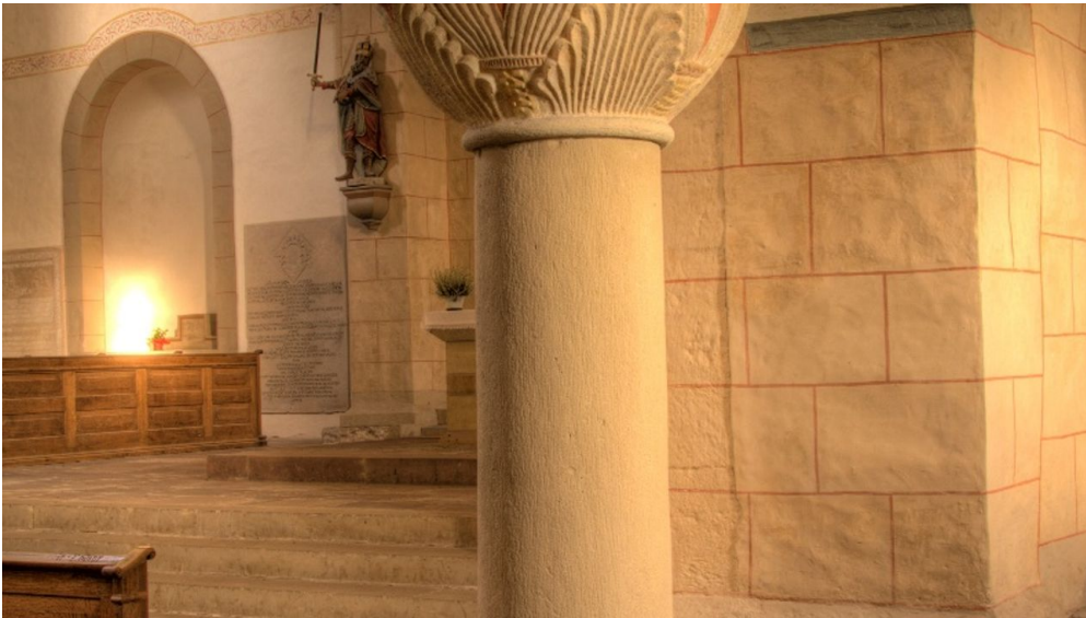
Die St. Kilianskirche

In den Wintermonaten wird die Kirche nur auf Anfrage geöffnet. Von Ostern bis Ende Oktober ist die Kirche täglich geöffnet. Führungen können über die Tourist-Information Lügde angemeldet werden.