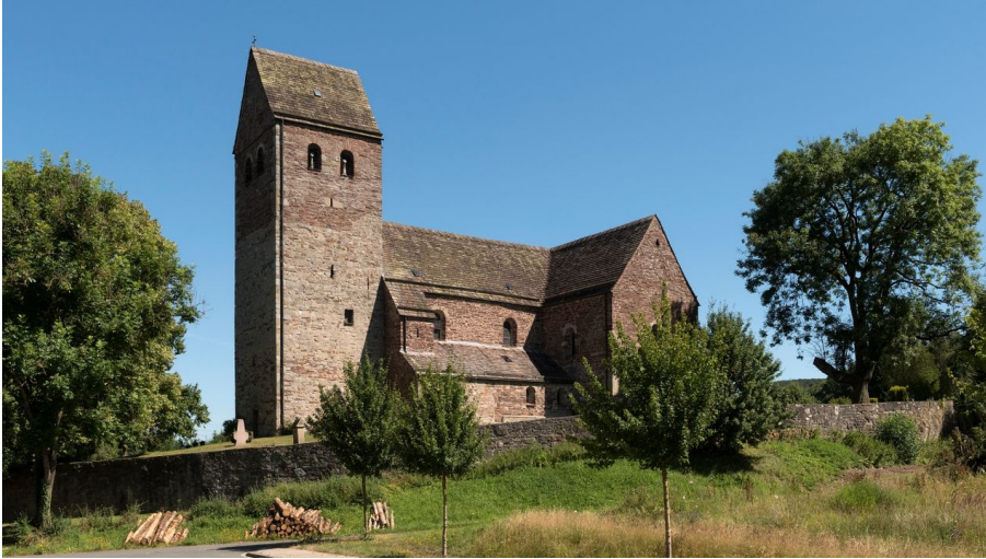
St. Kilianskirche Lügde - - touristinfo@luegde.de