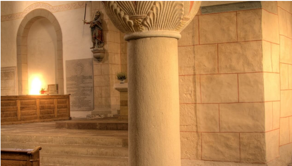
Die St. Kilianskirche

In den Wintermonaten wird die Kirche nur auf Anfrage geöffnet. Von Ostern bis Ende Oktober ist die Kirche täglich geöffnet. Führungen können über die Tourist-Information Lügde angemeldet werden.