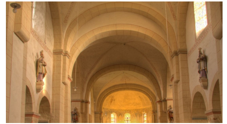
Der Altarraum der St. Kilianskirche