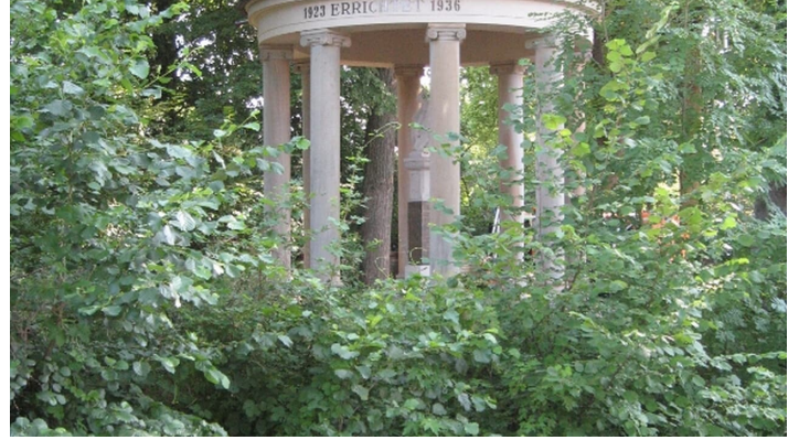
Gedenkstätte für die Gefallenen