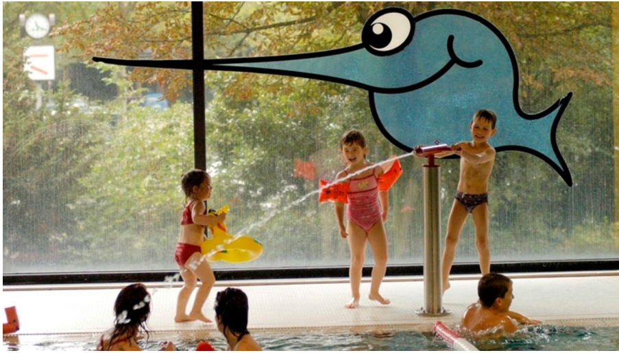
Schwimmoper - Kinderbecken