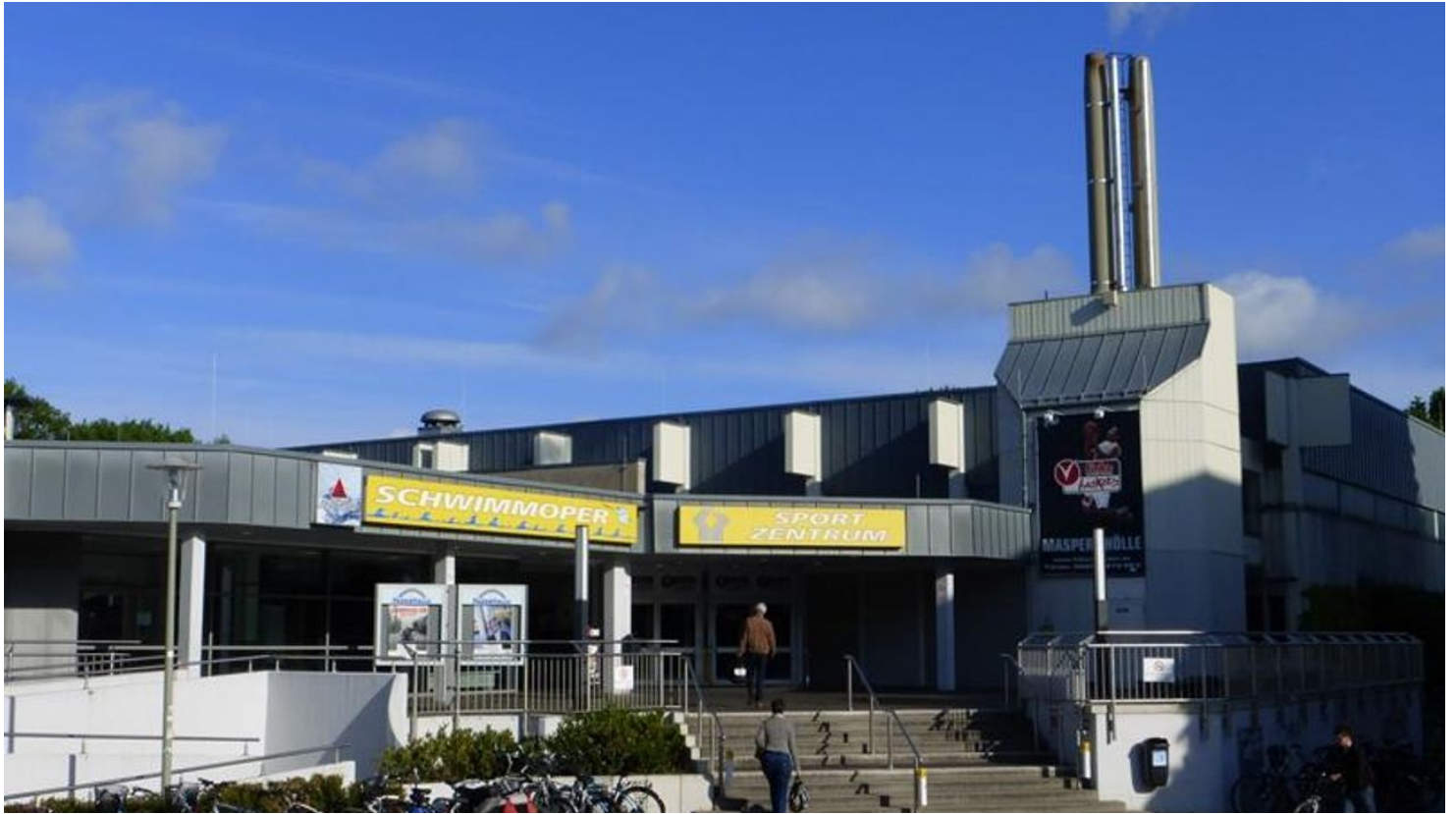
Schwimmoper - Eingangsbereich