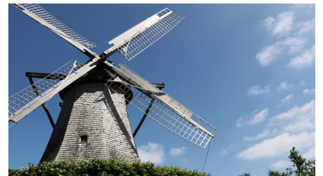
Desteler Mühle