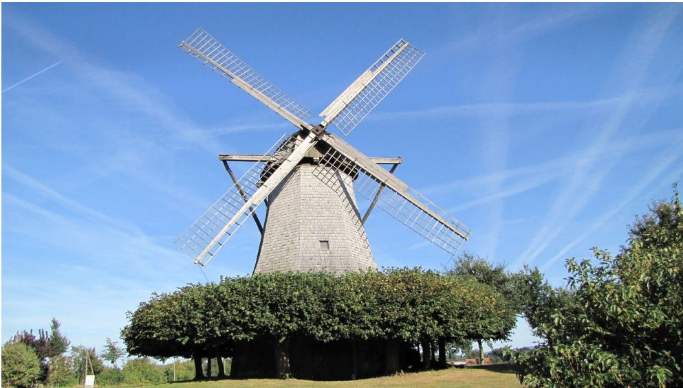
Destel Mühle