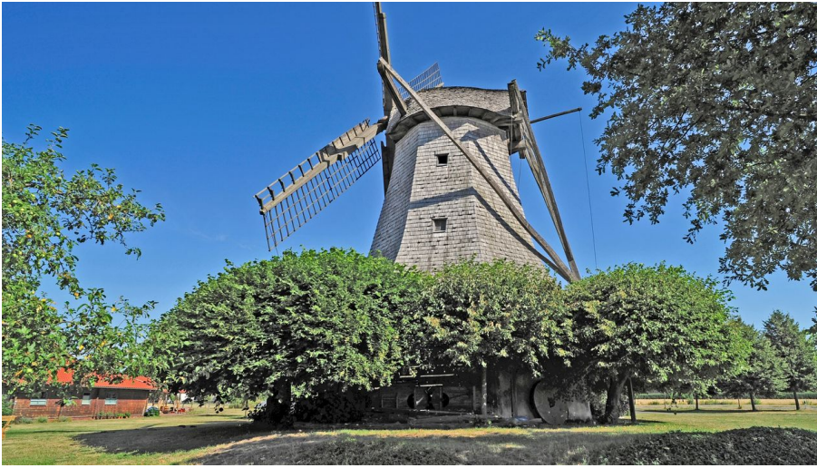
Windmühle Destel