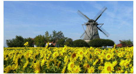
Mühle Destel