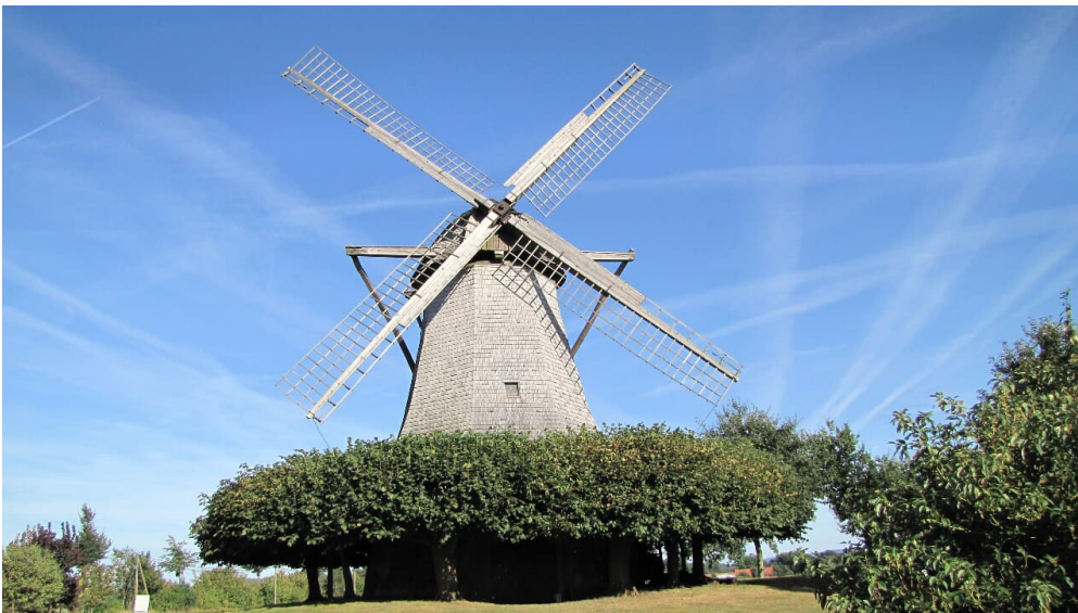
Destel Mühle