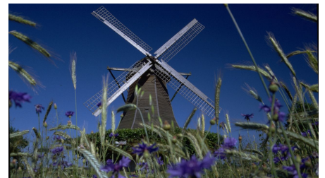
Windmühle Destel