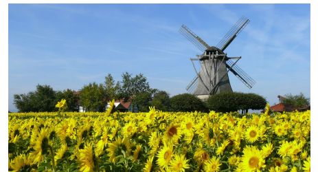
Mühle Destel