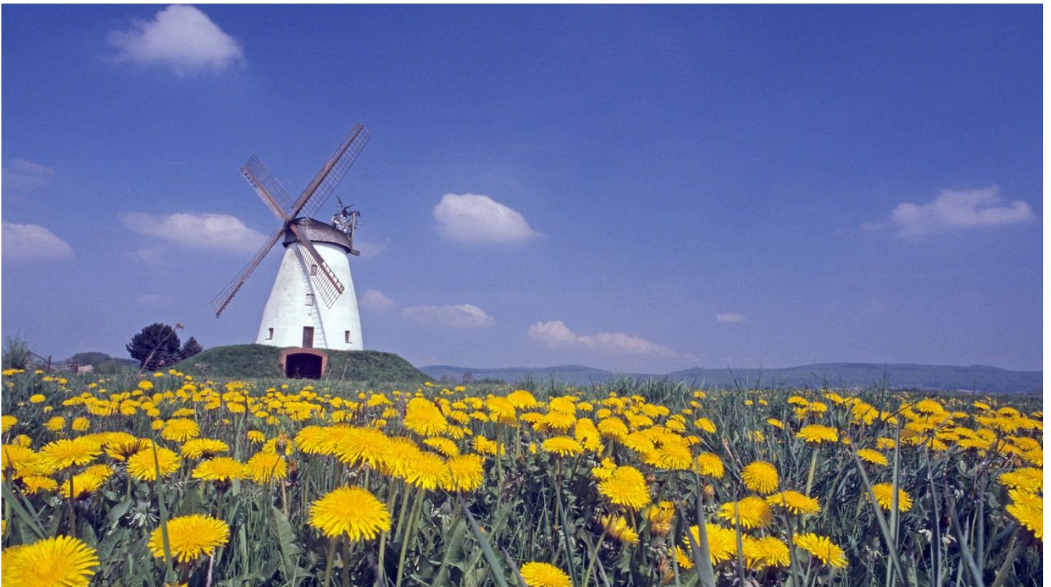
Windmuehle Veltheim - © G. Hedrich, Mühlenkreis Minden-Lübbecke