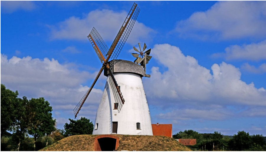
Windmühle Veltheim