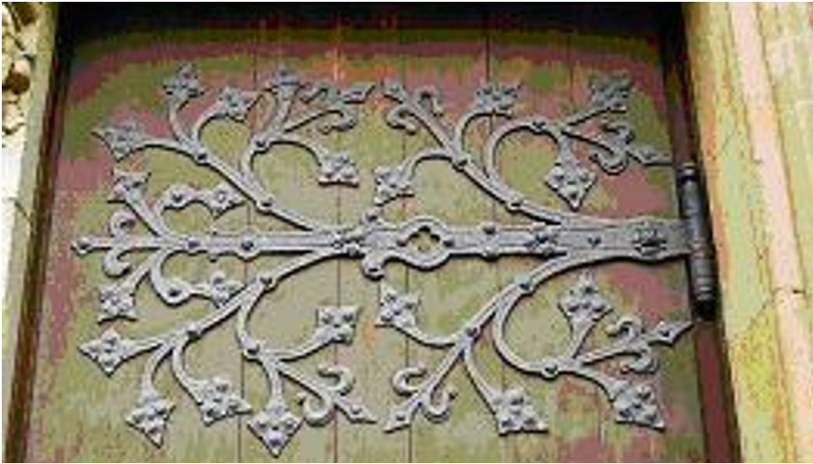
CK Schmiedekunst