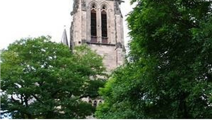
Christuskirche - © www.stadtdetmold.de/672.0.html?&L=0 .