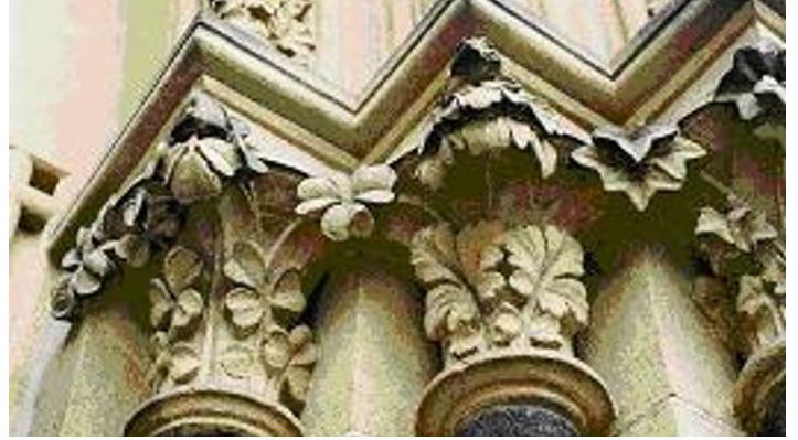
CK Ornamente