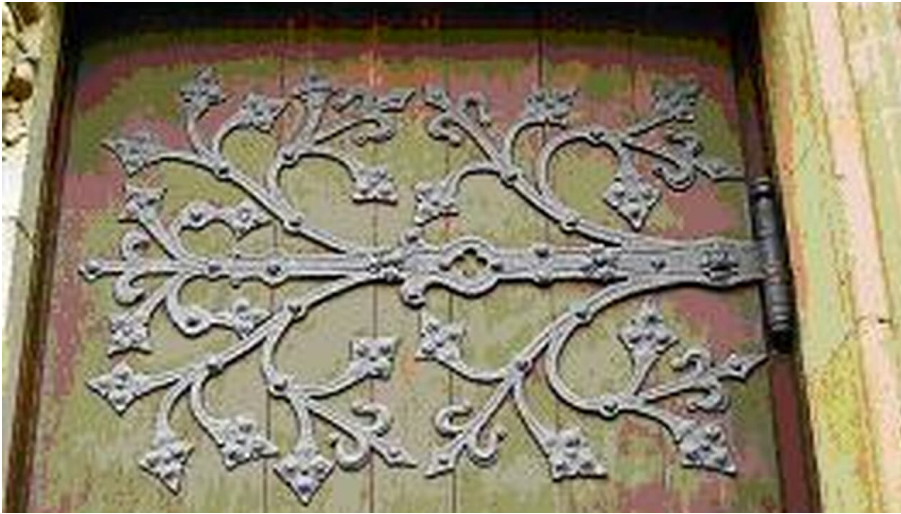
CK Schmiedekunst