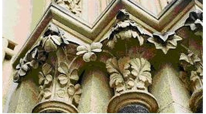
CK Ornamente - © www.detmold.de